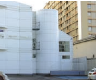
Maison des Associations, rue de la Saïda, ouverte en 2007.

La vitalité d'un arrondissement, au rythme de ses quartiers et de sa diversité, passe par la démocratie locale. Les conseils de quartier ne seront plus présidés par des adjoints au maire mais par des citoyens et joueront pleinement leur rôle. Ils deviendront, enfin, des lieux de concertation et non des tribunes politiciennes, des lieux de dialogue et de débat avec les élus, que les citoyens de cet arrondissement attendent. Nous retransmettrons les conseils d'arrondissement sur Internet . Nous donnerons la