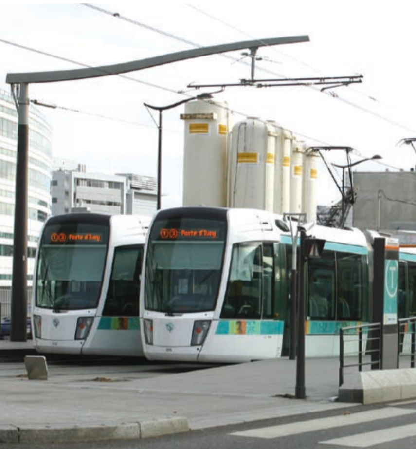
Le tramway des Maréchaux à la station Pont de Garigliano.

Pour aider les personnes handicapées, le fonctionnement du service Paris Accompagnement Mobilité (PAM) sera étendu les vendredis et samedis jusqu'à 2h du matin. Un forfait mensuel de course sera créé afin de pouvoir prendre le taxi. ●