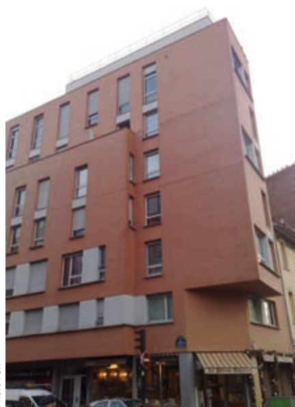
Logements sociaux Brancion-Lefèvre.

« E n 7 ans, 3400 logements sociaux ont été financés dans notre arrondissement. Beaucoup reste à faire car l'opposition systématique de l'UMP a considérablement entravé ce travail. Nous voulons aller encore plus loin et financer 4000 logements sociaux supplémentaires dans le 15 e durant la prochaine mandature.