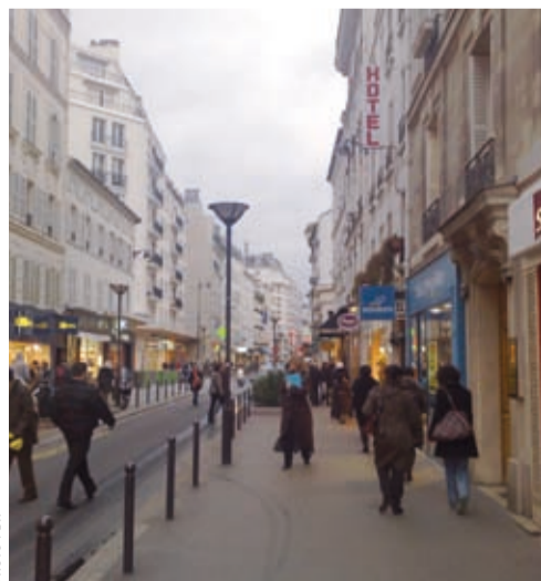
La rue du Commerce, après son aménagement en voie semi-piétonne.

La qualité des espaces publics est aussi une de nos ambitions. Dans le 15 e comme dans tout Paris, nous les rendrons plus sûrs et plus accueillants : à Balard grâce aux travaux de prolongation du Tramway vers la Porte de Versailles, ou encore aux abords du centre commercial Beaugrenelle rénové. ●