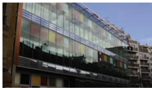
Médiathèque Marguerite Yourcenar, 41 rue d'Alleray

Nous installerons à Boucicaut les Lumières de la Ville, espace ouvert dédié au court-métrage . On y trouvera aussi des salles de répétition. Dans le quartier des Frères Voisin, nous ouvrirons le Café Zoïde, espace d'un nouveau type, ouvert aussi bien aux enfants qu'aux familles. Nous continuerons le développement de la lecture publique par la mise en réseau des fonds de la Médiathèque